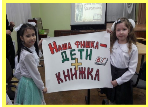
Книжные выставки, литературные игры