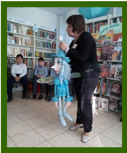
Экскурсии в библиотеку Автограда