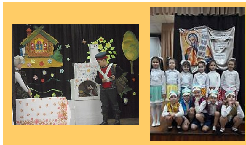
Литературные праздники, приуроченные к юбилеям писателей